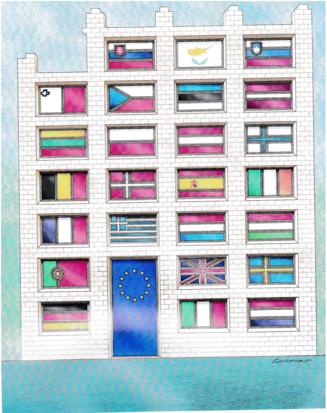
La maison Europe en 2006.